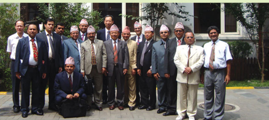
विश्व वातावरण दिवस २०६७ को अवसरमा वातावरण सम्बन्धी न्याली कार्यक्रममा सहभागीहरू ।