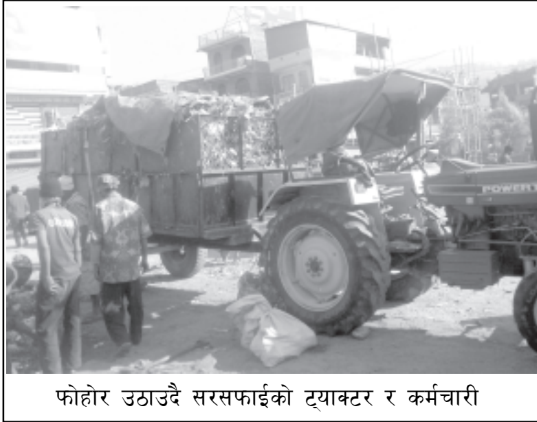
फोहोर उठाउदै सरसफाईको ट्र्याक्टर र कर्मचारी

क्षेत्र (नगरस्तरीय वातावरण सुधार तथा समन्वय समितिद्वारा संचालित “पुनःचक्रिय फोहर संकलन तथा बिक्री केन्द्र”) को पनि नगरको फोहर व्यवस्थापनमा अप्रत्यक्ष तर महत्वपूर्ण भूमिका रहँदै आएको छ ।