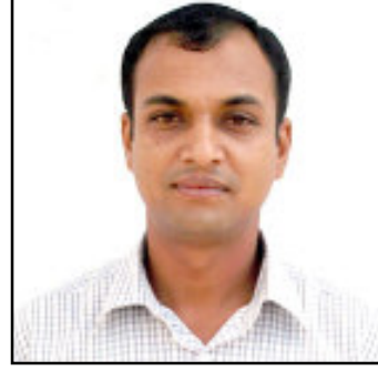
सरसफाई प्राविधिक-शिशिर श्रेष्ठ

नगरपालिकाले गरी आएका मुख्य कार्यहरू मध्ये एक महत्वपूर्ण कार्य ठोष फोहर मैला व्यवस्थापन रहेकोछ । स्थानीय स्वायत्त शासन ऐन २०५६ मा भएको प्रावधान अनुसार नगरपालिका क्षेत्र