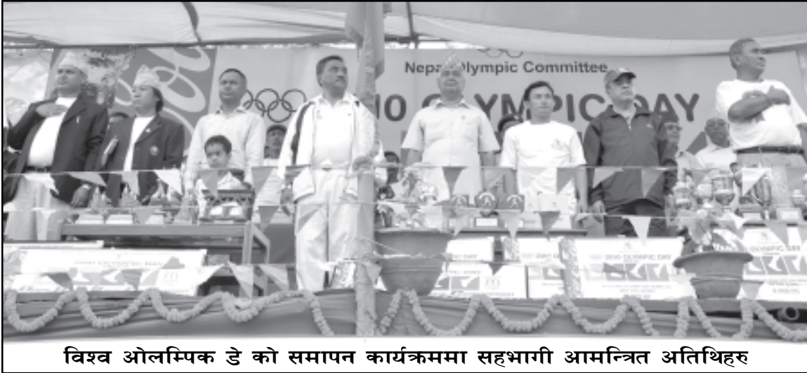
विश्व ओलम्पिक डे को समापन कार्यक्रममा सहभागी आमन्त्रित अतिथिहरू

देखि ०९ गते सम्म) विभिन्न कार्यक्रमहरूका साथ भव्यताका साथ मनाईएको छ ।