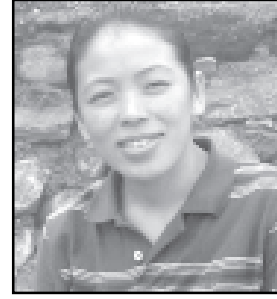
□ पूर्णकला राई