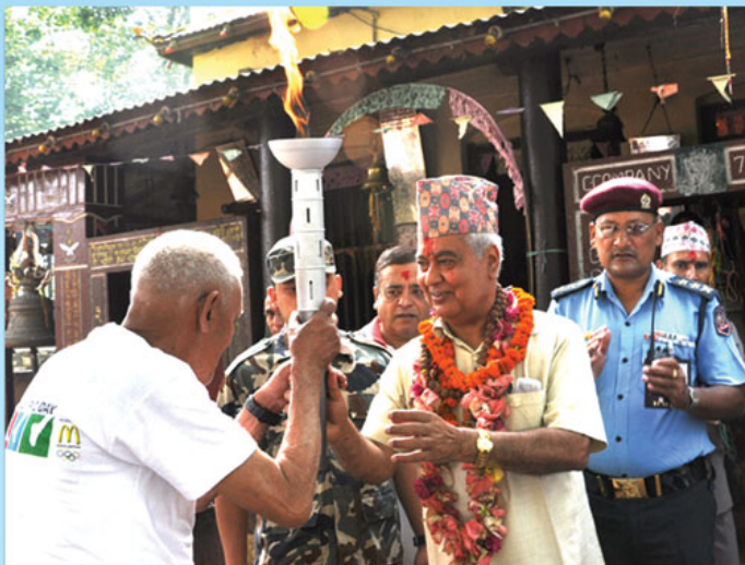
१७ - २३ जुलाई, २०१० मा धरानमा भएको ओलम्पिक डे मा नेपालका पहिलो ओलम्पियन भुपेन्द्र सिलवाललाई ओलम्पिक टर्च हस्तान्तरण गर्दै उपराष्ट्रपति परमानन्द भा ।