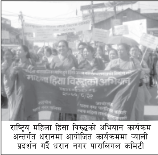
राष्ट्रिय महिला हिंसा विरुद्धको अभियान कार्यक्रम अन्तर्गत धरानमा आयोजित कार्यक्रममा याली प्रदर्शन गर्दै धरान नगर पारालिगल कमिटी

नेपालमा महिला तथा बालबालिकाको क्षेत्रमा ४० दशक भन्दा लामो समयदेखी साभेदारको रूपमा काम गर्दै आएको यूनिसेफले नेपालको विभिन्न २३ वटा विकट तथा विपन्न जिल्लाहरूका महिला तथा बालबालिकाहरूको शिक्षा, स्वास्थ्य, सरसफाइ, अधिकार सम्बन्धी काम गर्दै आएको छ । यूनिसेफले आफ्ना कार्यक्रमहरूलाई अझ प्रभावकारी बनाउन १० वर्ष अघि देखी Decentralized Action for Child & Woman (DACAW) कार्यक्रम संचालनमा ल्याएको छ । जस अन्तर्गत सुनसरी जिल्लाका ३ वटा नगर