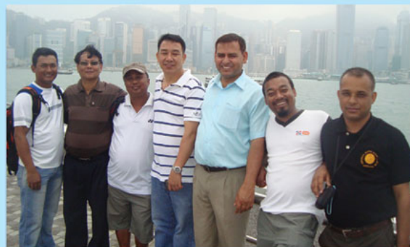
आयोजकको हङकङ सहर दृष्यावलोकन कार्यक्रममा सहभागी हुदै ।