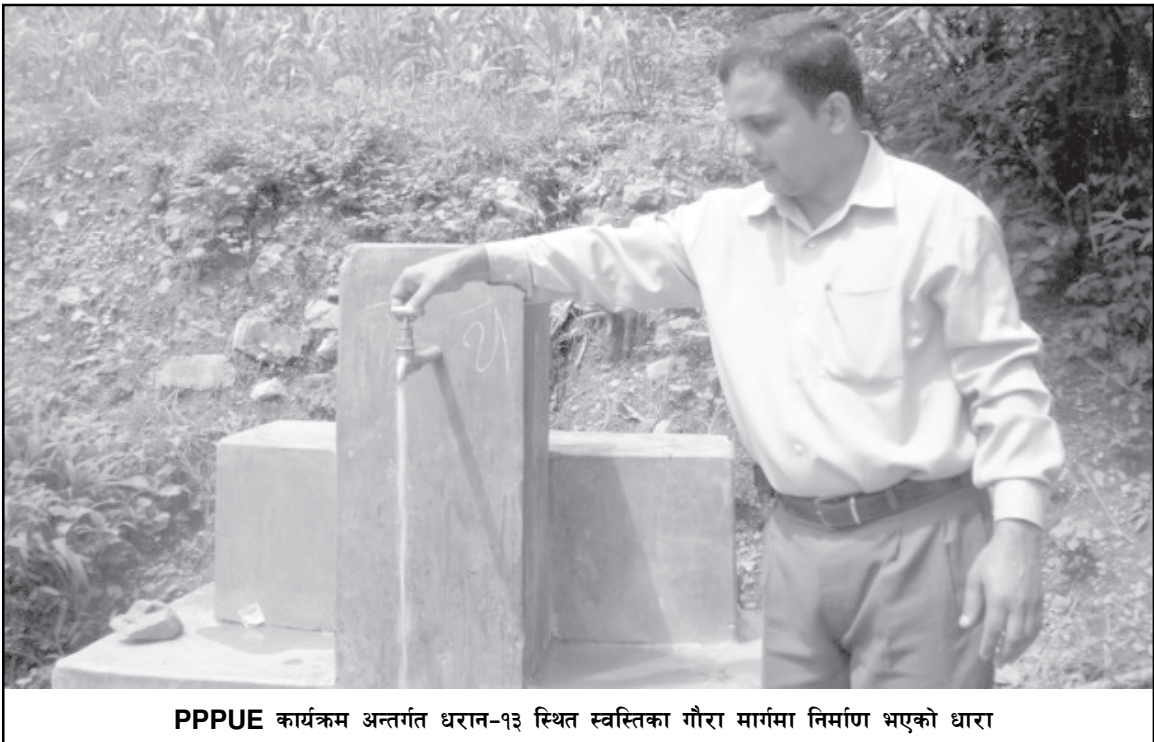
PPPUE कार्यक्रम अन्तर्गत धरान-१३ स्थित स्वस्तिका गौरा मार्गमा निर्माण भएको धारा

सम्भाव्य परियोजनाहरूको अध्ययन तथा छनौट गरिरहेको छ । परियोजनाहरूको अन्तिम छनौट भइसकेपछि पूर्णरूपमा सार्वजनिक निजी साझेदारीमा ती परियोजनाहरू संचालन गर्नको लागि आवश्यक प्रकृया अघि बढाइनेछ । यसबाट नगरपालिकाले ती क्षेत्रहरूमा गर्नुपर्ने लगानीको