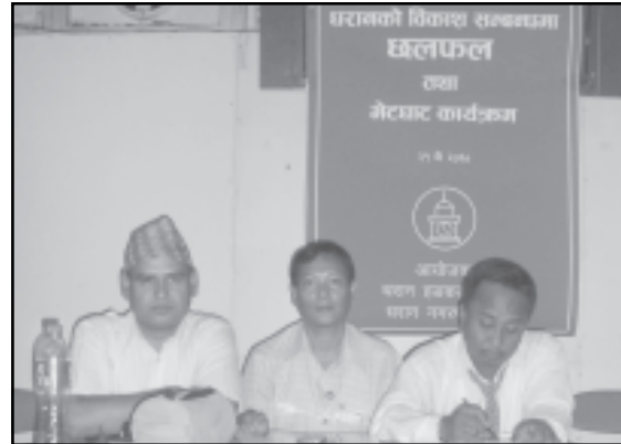
वडागत छलफल कार्यक्रममा सहभागी हुँदै भ्रमण टोली

१० औं वार्षिक उत्सव कार्यक्रम पश्चात भ्रमण टोली विभिन्न मितिहरूमा हडकडमा धरानको वडा अनुसार संगठित भई बसेका वडावासीहरू, विभिन्न समाज तथा संघसस्थाहरूसंग भेटघाट तथा छलफल कार्यक्रममा सहभागि भएको थियो । उक्त कार्यक्रमहरूमा सहभागिहरूबाट समग्र धरानका समस्याहरूका बारेमा चासो एवं चिन्ता व्यक्त गरिएका थिए भने धरानको विकासकालागि धरान र