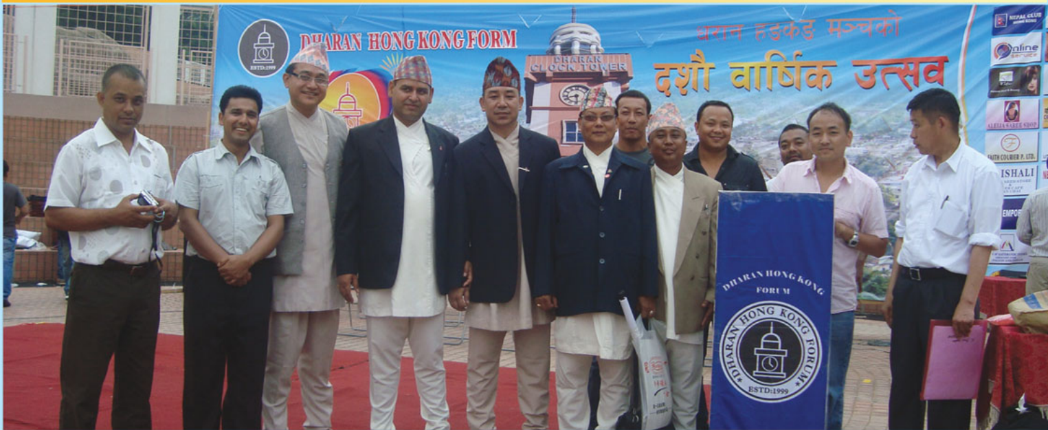
धरान हङकङ मञ्चको १० औं वार्षिक उत्सव उद्घाटन समारोहमा सहभागी हुदै धरान नगरपालिकाका कार्यकारी अधिकृतको नेतृत्वको टोली