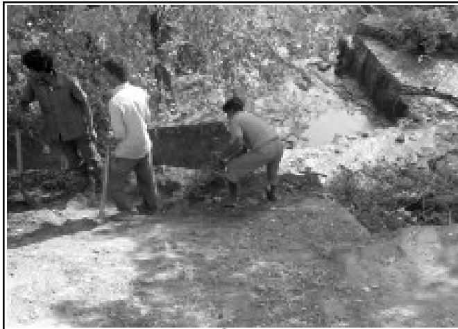
ढल सफा गर्दै सरसफाईकर्मी

नगरपालिका, गठन तथा परिचालन, नगर क्षेत्रमा मासिक वातावरणिय अनुगमन जस्ता कार्यहरु संचालन भईरहेको छ । साथै राष्ट्रिय सरसफाई सप्ताह, विश्व वातावरण