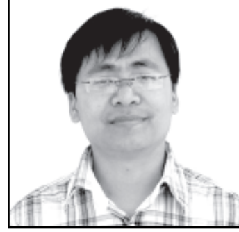
सूचना सहायक-शिव चाम्लिड

प्रत्येक वर्ष June महिनाको २३ तारिक अन्तराष्ट्रिय ओलम्पिक कमिटीको स्थापना दिवसको उपलक्ष्यमा विश्वका सबै देशहरूमा खेलकुदको शहरको रूपमा परिचित शहरमा विविध कार्यक्रमका साथ विश्व ओलम्पिक दिवस विश्व