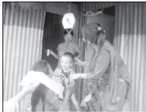
मासिक बच्चा तौल कार्यक्रममा बच्चाको तौल लिइँदै

धरान नगरपालिकाको सन्दर्भमा सन् २००१ (मिति २०५९ आषाढ) देखि DACAW कार्यक्रम संचालनमा रहेको छ । यस कार्यक्रमले धरानको विपन्न तथा सुकुम्बासी वस्तीहरूमा महिला समूह गठन गरी त्यस क्षेत्रमा बचत, शिक्षा, स्वास्थ्य, पोषण, महिला अधिकार, बाल अधिकार,