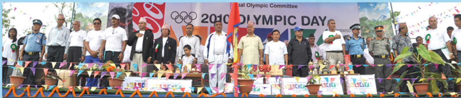
ओलम्पिक डे को उद्घाटन कार्यक्रममा सहभागी हुदै उपराष्ट्रपति परमानन्द भा लगायत पदाधिकारीहरु ।