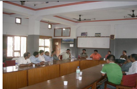
धरान नगरपालिकाका कार्यकारी अधिकृत संग भएको छलफल